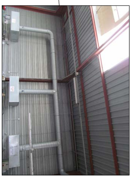
Hottes zone recyclage gaz inhibiteur