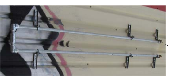
Conduite rejet gaz inerte