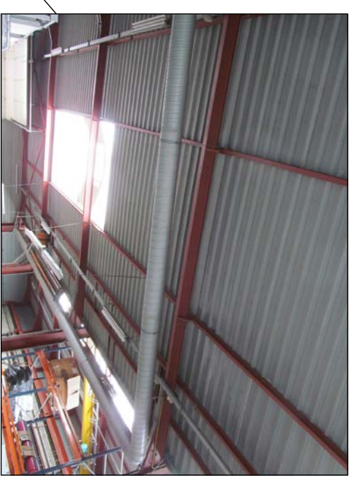
Conduite zone recyclage gaz inhibiteur