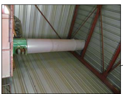
Conduite zone d'application peinture