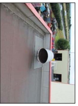
Cheminée en toiture zone d'application peinture