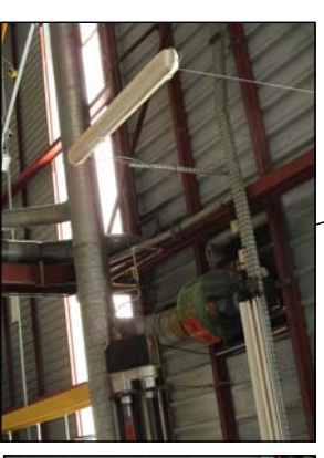
Extracteur zone recyclage gaz inhibiteur