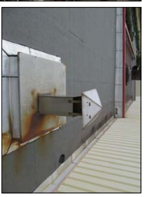
Cheminée en toiture zone recyclage gaz inhibiteur